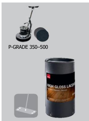
Pro podlahy ve vysokém lesku