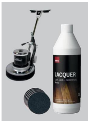
Pro podlahy v saténovém laku

Hlavním důvodem opětovného lakování je potřeba "osvěžit" vzhled podlahy po jejím mnohaletém používání.