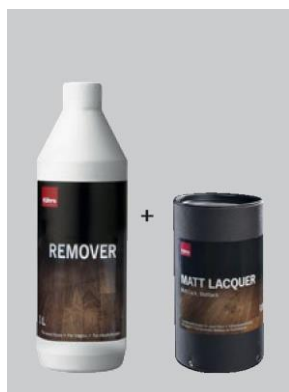
Pro podlahy v matném laku

Podlahu omyjte čistou vodou s lehce navlhčeným hadrem. Použijte co nejméně vody. Zvláštní opatrnosti je potřeba u bukových dřevin, přílišná vlhkost může poškodit krátké konce lamel.