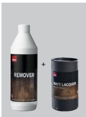
Pro podlahy v matném laku

Silné alkalické čisticí prostředky lze použít nejdříve za 3 týdny.