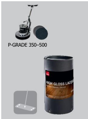
Pro podlahy ve vysokém lesku